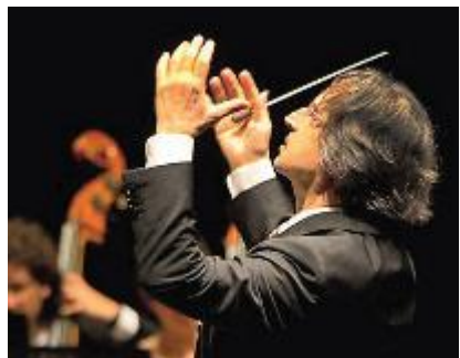
Riccardo Muti dirige 'Aida' in forma di concerto