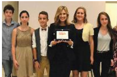
Jennifer Niven con alcuni giovani giurati

Seguitissima, per la sua capacità di raccontare le sfumature dell'adolescenza con talento e delicatezza, la scrittrice americana Jennifer Niven sarà a Rimini con 'Un Mare di Libri'. Oggi alle 18 al Bagno Tiki 26 presentazione dell'ultimo romanzo "L'universo nei tuoi occhi". A seguire possibilità di partecipare a un'apericena con l'autrice (prenotazione ☎ 0541 25357). Domani Niven sarà alla libreria Viale dei Ciliegi 17 per un firma copie dalle 10.30.