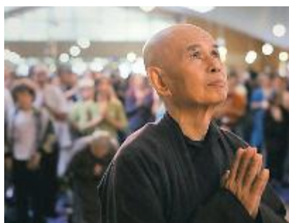
Una scena di 'Walk With Me' da oggi nelle sale

Il documentario 'Walk With Me' di Marc Francis e Max Pugh sulla straordinaria vita della comunità monastica del maestro zen Thich Nath Hanh, che insegna l'antica arte della meditazione buddhista nota come Mindfulness, oggi nei cinema di Rimini (Multiplex Le Befane), Reggio Emilia (Rosebud), Ferrara (Boldini) e il 21 settembre a Bologna al Galliera. Narrato dalla voce di Benedict Cumberbatch, è stato realizzato in tre anni nel monastero in Francia, ma anche on the road negli Usa.